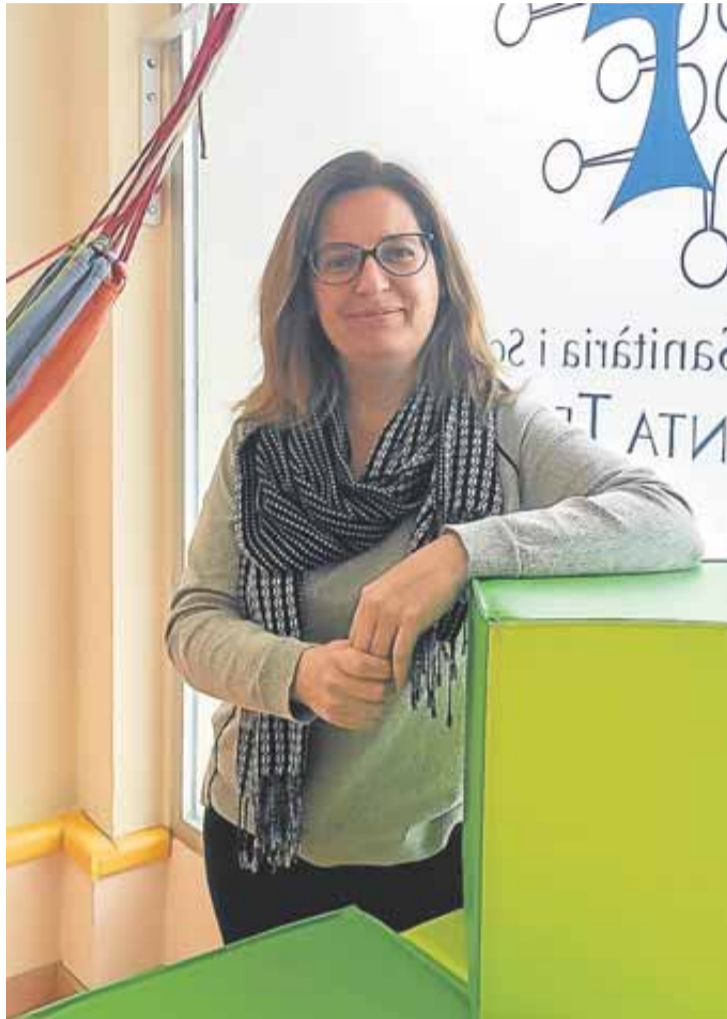
M. a José trabaja en Tarragona y tiene el blog Neuronas en desarrollo.

No estoy en absoluto de acuerdo con eso. La sociedad está cambiando. En estos momentos, la gente va a buscar en la red su problema te guste o no. Si los profesionales sanitarios, los que