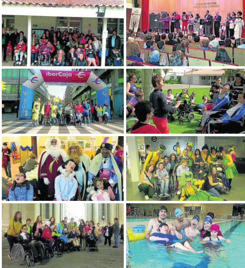
Diferentes imágenes de las salidas y actividades de los socios de la entidad. ARAPRODE

En la entidad también cubren otras muchas necesidades de estos niños y sus familiares y lo hacen a través de sus acampadas de respiro familiar, los campamentos