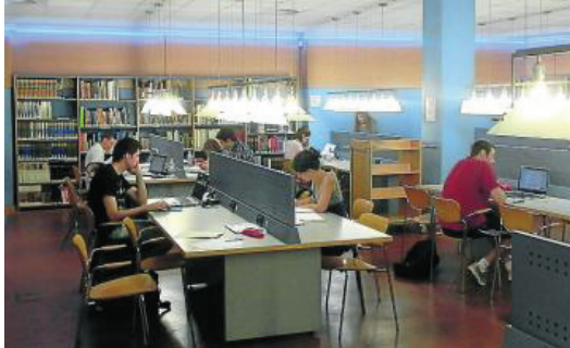
La ampliación de horarios se mantendrá hasta el 24 de junio.

En los últimos años el incremento sostenido de usuarios; sus modernas instalaciones, adaptadas a las necesidades del público