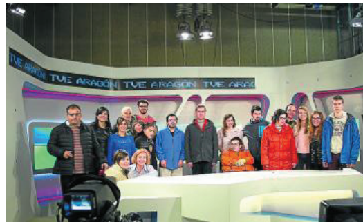
Integrantes del equipo que ha rodado el corto. A.A.

que se ha desarrollado en los talleres, a los nueve participantes «se les ha dotado de un puente de conexión en el aprendizaje, la enseñanza y la comunicación mediante las estrategias desarrolladas en las artes escénicas, en concreto, el arte dramático, la interpretación y el doblaje», señalan desde Autismo Aragón.